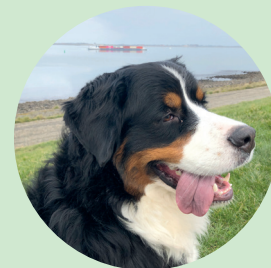
Dinsdagochtend Wandelen langs de Oosterschelde