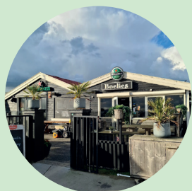
Zondagochtend Verzamelen bij Boelies

We staan vandaag vroeg op, want gaan bij Hellevoetsluis wandelen met onze hond Lady en de Berner Sennenclub. Meestal zijn we met zo'n 30 Berner Sennens en 50 baasjes. We ontbijten en stappen in de auto. Na een uurtje rijden, verzamelen we bij Boelies, een restaurantje dat grenst aan de Haringvlietdam. Ik train Lady om geen zeewater meer te drinken en dat lukt goed. Nadat de honden heerlijk konden rennen, door het water springen en spelen, drinken en eten we nog wat met elkaar.