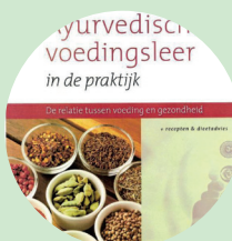
Maandagmiddag Zoommeeting Ayurvedische voedingsleer