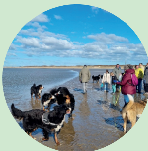
Zondagmiddag Wandelen met de Berner Sennenclub