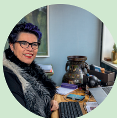
Maandagochtend Offertes nalopen